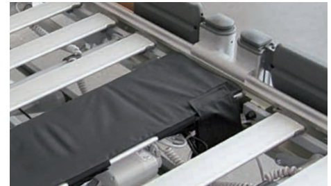
Die Bed-Exit-Sensormatte registriert neben der Bettanwesenheit auch die Bewegungsprofile des Bewohners im Bett.

// Sensorik-Funktionen modular erweiterbar