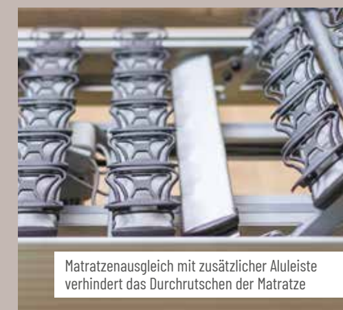
Matratzenausgleich mit zusätzlicher Auleiste verhindert das Durchrutschen der Matratze