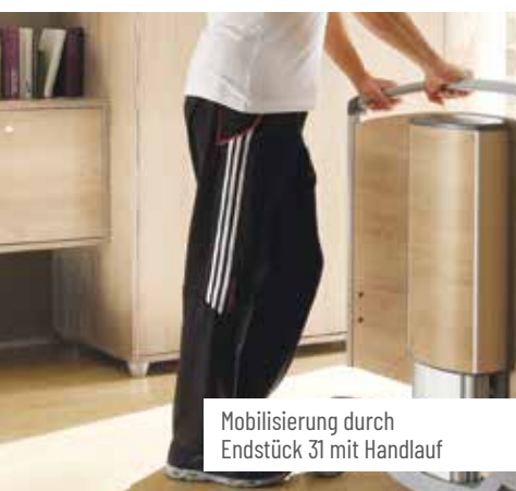
Mobilisierung durch Endstück 31 mit Handlauf

*Abstand zwischen Oberkante Liegefläche und Oberkante hochgezogene Seitensicherung