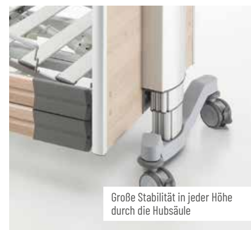
Große Stabilität in jeder Höhe durch die Hubsäule